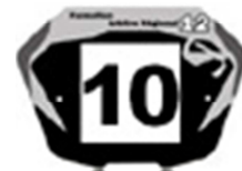
Elite F et G

A noter que les pilotes de la catégorie Novice doivent mettre les mêmes plaques que tous les autres pilotes de la catégorie garçon « Fonds Jaune avec les chiffres noirs »