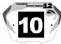
Junior F et G