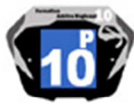
Filles / Femmes